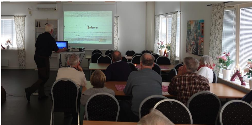
Bildvisning 3 december 2023.

Intressanta fågelföredrag samt att fågelåret avslutas med en uppskattad bildvisning, där föreningens medlemmar visar sina fågelbilder.